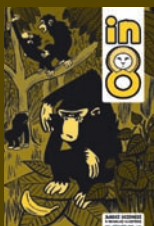
in8 n°3 – décembre 2009