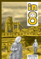
in8 n°1 – janvier 2009

INFOS : 071 64 10 61 - MAISON.HAINAUT.BE - IN8.BE