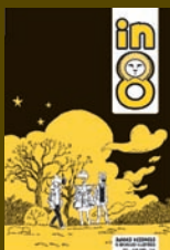
in8 n°2 – juin 2009